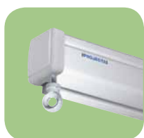
Handbediente Projektionswand in hohe Qualität