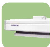
Easy Install mit Kunststoffhalterungen