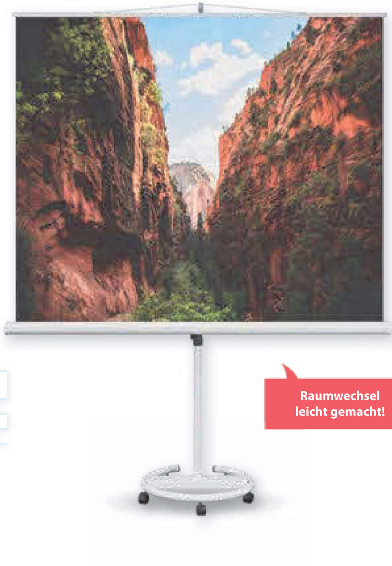
MEDIUM CombiFlex Mobil